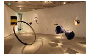
David Tudor & Composers Inside Electronics

Rainforest V (Variation 2), 1973/2015 Museum der Moderne Salzburg – Angekauft mit Mitteln der Generali Foundation Ausstellungsansicht E.A.T. , 25. Juli – 1. November 2015