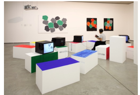
Vorne: Heimo Zobernig, Ohne Titel , 2000; Bruce Nauman, diverse Videos, 1968–1973; Sammlung Generali Foundation – Dauerleihgabe am Museum der Moderne Salzburg; hinten: Günther Förg, Tropfenbild I, II und III , 2001, Museum der Moderne Salzburg – Dauerleihgabe der Sammlung MAP

Blau, gelb, grün, schwarz, weiß ... Farben gibt es viele zu entdecken in unserer aktuellen Ausstellung. Wie setzen Künstler_innen diese in ihren Werken ein? Und warum haben sie wohl genau diese Farben gewählt? Was verbindet man mit bestimmten Farben? Mit unserer Kunstvermittlerin geht es auf eine kleine Erkundungsreise zu den unterschiedlichsten Werken von Malerei über Skulptur bis hin zur raumfüllenden Installation.