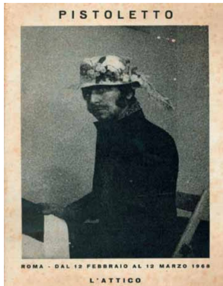
Pia Epremi, Pistoletto & Sotheby's , Februar 1968, zugleich Titel des Programms zur Personale in der Galerie L'Attico, Rom, Februar 1968

junge Pistoletto dem Quasi-Sakralen einen selbstverständlichen Platz in seinem Werk eingeräumt hat, wie er auch die eigene Person in sicherem Wissen um die Wirkung von Vorbildern aus der jüngeren Kunstgeschichte zu stilisieren weiß. Wenn er mit leicht schelmischem Blick mit einem blumengeschmückten Hut posiert, liegt darin ein Rekurs auf eine andere Tradition, das tableau vivant . Die Pose selbst ist nichts anderes als eine Hommage an einen frühen Großmeister des Abgründigen und Sarkastischen an der Schwelle zur Moderne, dem satirisch konnotierte Ausflüge in die Sakralsphäre dabei nicht fremd waren: James Ensor – dessen Autoportrait au chapeau fleuri (Ostende, Museum) hier filmisch paraphrasiert wurde (Pia Epremi, Pistoletto & Sotheby's , Februar 1968). Das Foto gelangte auf das Cover des Programms für die gleichzeitige Personale in der Galerie L'Attico, Rom.