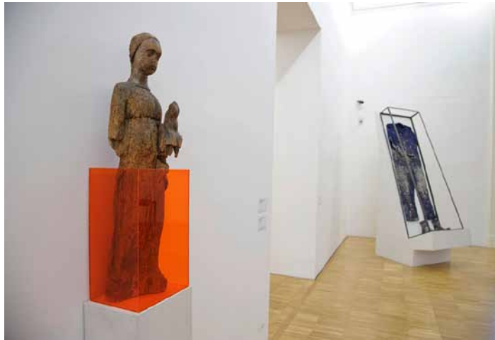
Michelangelo Pistoletto, Ausstellungsansicht, Neue Galerie Graz, 2012

Pistoletto macht da, so scheint es, keine Ausnahme. Schon in dem Film Buongiorno Michelangelo (Ugo Nespolo, 1968/69) ist das Heilige präsent, wenn auch auf denkbar unauffällige Weise. Es braucht freilich einige Zeit, bis man es im vollgeräumten Atelier des jungen Künstlers entdeckt. Die hektische, die verblüffende Ereigniskette nachzeichnende Kameraführung zwingt uns zu mehrmaligem Hinschauen, um dann jene unscheinbare mittelalterliche Holzmadonna wahrzunehmen, die zuletzt auch in der Grazer Ausstellung gezeigt wurde. Hier wurde sie, ohnehin nur das Werk eines regionalen Anonymus, in leichter Verfremdung präsentiert, ohne dem Stück die sakrale Würde zu nehmen. Indem Pistoletto die unteren Körperpartien des einfachen Bildwerkes mit einer transparenten Umkleidung versehen hat, spielt er bewusst mit dem Auratischen der gerade in ihrer Schlichtheit überaus eindrucksvollen Figur, die aber nicht mehr Kultbild bzw. museales Kunstwerk, sondern erst einmal Gegenstand ist. Doch ist es paradoxerweise diese so platt anmutende Objekthafte, das dem Sublimen wie durch die Hintertür Eingang in unser Bewusstsein verschafft: Unweigerlich hat sie den Charakter eines Idols angenommen. Mag es auch nur ein Requisit, eine Erinnerung etc. sein, der künstlerische Akt macht aus ihr kurzum ein heiliges Ding.