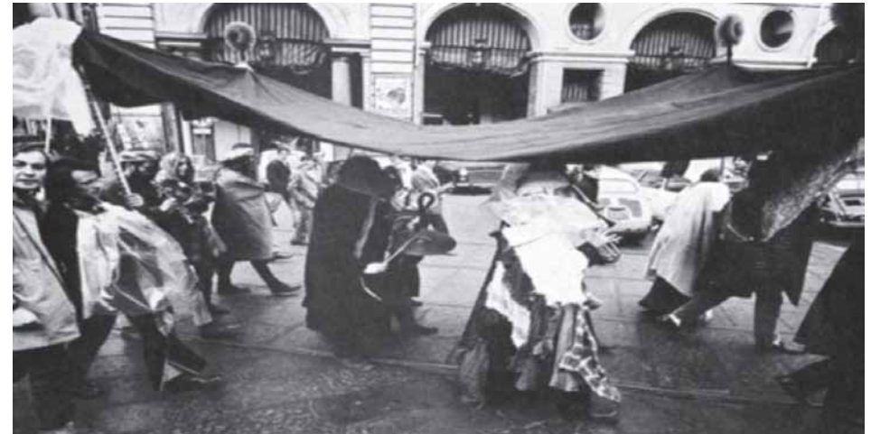
Michelangelo Pistoletto, Teatro Baldacchino, Turin, 15.12.1968

MP: Nein, ich schreibe es nicht in Graz, aber ein Teil davon wird hier erzählt. Das Manifest besagte, dass es mittlerweile unerlässlich ist, sich in den verschiedenen Bereichen des sozialen Lebens zu engagieren, will man dem Konzept der Macht einen neuen Sinn verleihen. Der Kunst genug Macht zu verleihen, das System der Macht zu ändern. Das ist das grundlegende Prinzip. Alle sagten, „Oh, tolle Idee, bravo, aber das ist reine Utopie.“ Letztendlich aber, ganz langsam, führte Cittadellarte diese Idee aus der Utopie heraus. Und jetzt sind wir in der Realität verwurzelt. Und ich denke, diese Schau hier zeigt, dass diese Realität Bestand hat, nicht nur wegen Cittadellarte, sondern weil rund um die Welt in diesen letzten zwei Jahrzehnten so viele Dinge passiert sind und so viele Künstler einen Weg in Richtung Veränderung eingeschlagen haben. Diese Ausstellung präsentiert eine begrenzte Anzahl dieser Aktivitäten, doch ich bin mir sicher, wir könnten eine Schau wie diese inszenieren, die sich auf die ganze Stadt ausdehnte, so viele ähnliche Aktivitäten gibt es innerhalb der Dimension der Veränderung. Künstler übernehmen so viel Verantwortung,