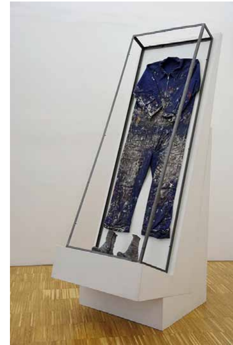
Michelangelo Pistoletto, Ausstellungsansicht, Neue Galerie Graz, 2012, Foto: N. Lackner/UMJ

Was nun das „Turiner Grabtuch“ angeht, so mag hier dasselbe gelten wie im Falle von Pistolettos Einstellung zu religiösen Fragen überhaupt, es ist aufgehoben in der Erinnerung an eine reiche kulturhistorische Vergangenheit. Auf Gegenwart und Zukunft hingegen zielt Pistolettos aktuelles, recht ambitioniertes Projekt eines „dritten Paradieses“,