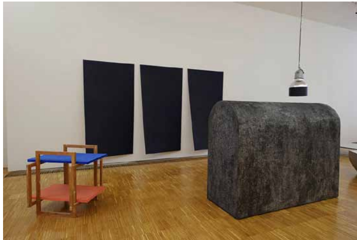
Michelangelo Pistoletto, Ausstellungsansicht, Neue Galerie Graz, 2012

Glaubensrichtungen haben schließlich ihre Priester gehabt, warum sollte es bei der Kunst anders sein?