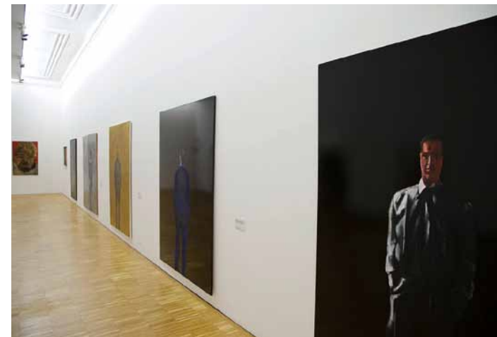
Michelangelo Pistoletto, Ausstellungsansicht, Neue Galerie Graz, 2012, Foto: N. Lackner/UMJ

MP: Die Plakatwände zeigten ein von einem Observatorium gemachtes Foto des Universums, mit allen Sternen des sichtbaren Universums. Ich schuf eine Arbeit, die zeigte, dass jeder Punkt in Universum sein Zentrum ist. Darum ging es bei der Plakatwand. Jeder Punkt im Universum ist sein Zentrum. Es gibt kein Zentrum im Universum, so habe ich das herausgefunden.