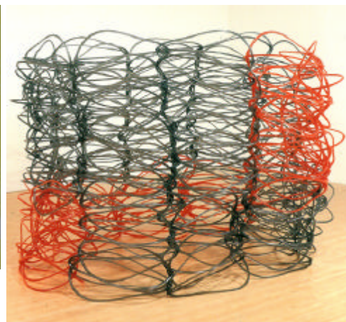
Liz Larner, Reticule, 1999 187,96 x 284,48 x 203,2 cm, cast polyurethane