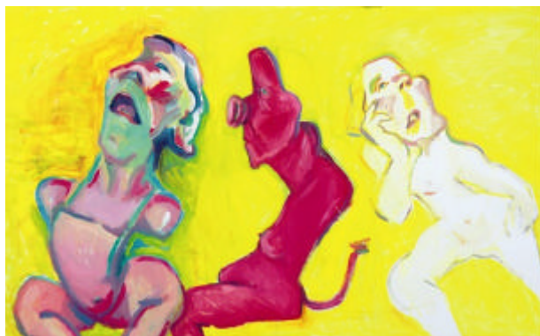
Maria Lassnig, 3 Arten zu sein, 2004 Öl auf Leinwand, 150x200cm

Wir bitten um Voranmeldung unter T +43-316/8017-9200