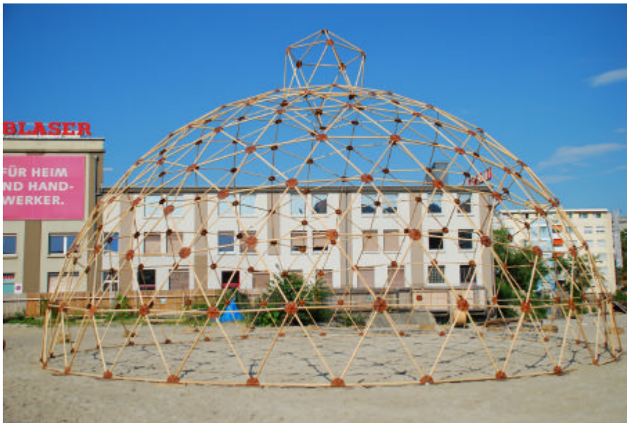
airline, airtrain , 2007

22. September 2007 bis 13. Jänner 2008, Space02 und öffentlicher Raum Eröffnung 22. September, 11:00 Uhr