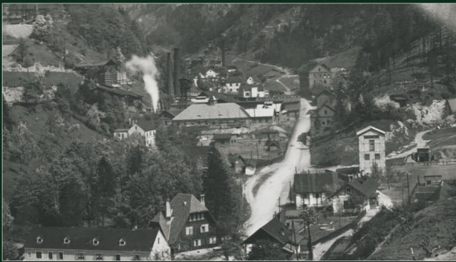
Kohlebergbau im Seegraben um 1920

Nördlich von Leoben wurde über 200 Jahre lang Kohle bergmännisch gewonnen, die vor allem in den eisenverarbeitenden Betrieben Verwendung fand.