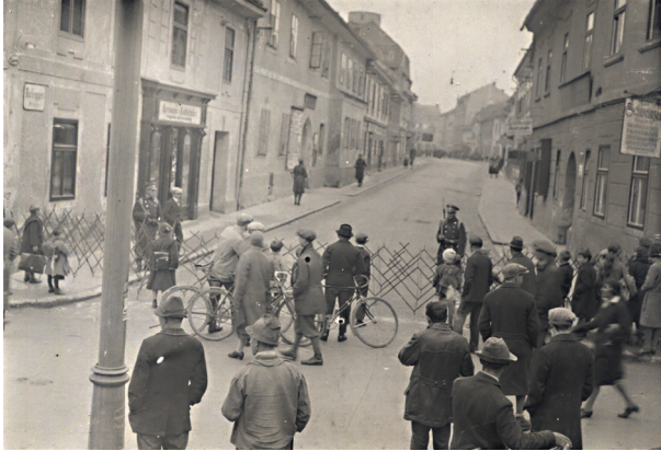
Februar 1934, Barrikaden in Bruck a. d. Mur