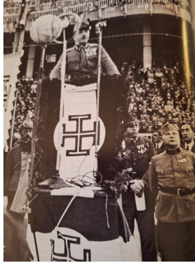
Ansprache Engelbert Dollfuß