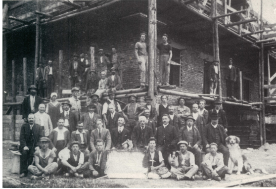
Februar 1934, St. Michael