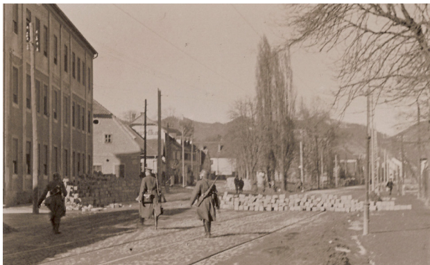
Februar 1934; Wienerstraße Ecke Josef- Pock-Straße