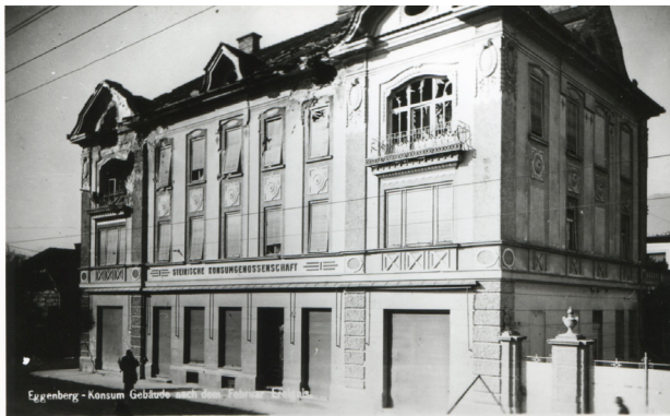
Februar 1934, Konsum in Graz- Eggenberg