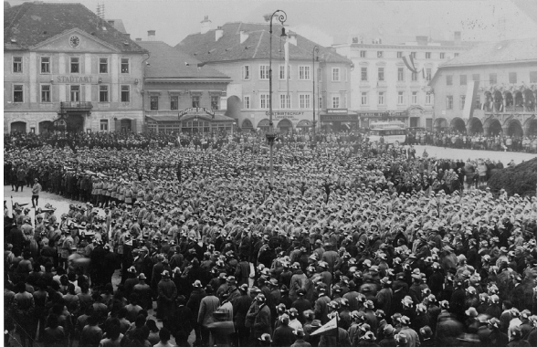
Bruck a. d. Mur