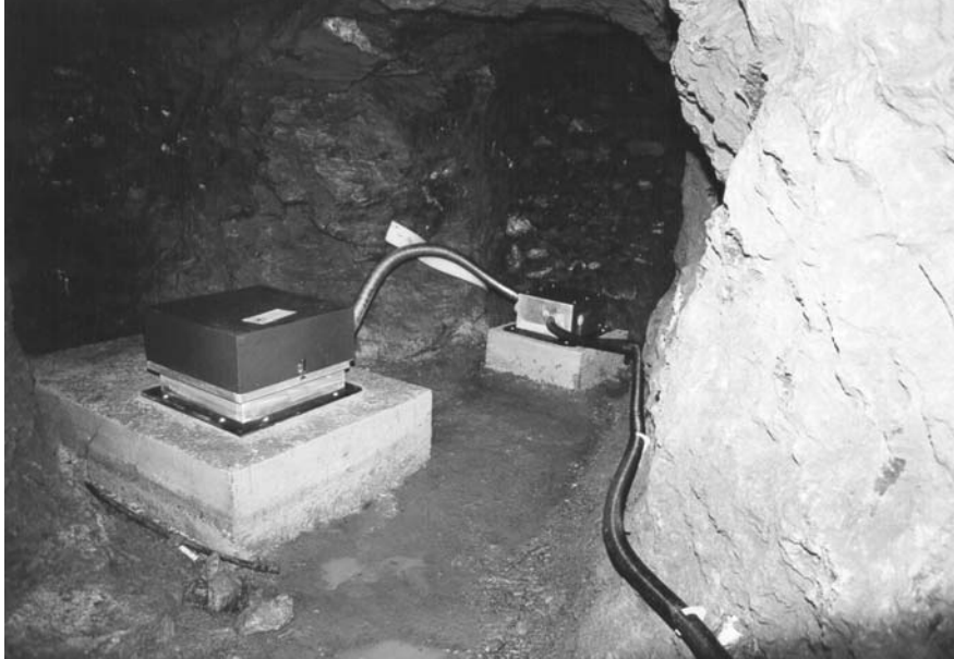
Abb. 2: Seismometerstandort der Station ARSA. Fig. 2: Seismometer at ARSA.

Kernstück der Anlage ist das Seismometer, in diesem Fall – wie bei allen Breitbandstationen Österreichs – vom Typ STS-2. Dieser Sensor zählt zu den modernsten im Handel erhältlichen Geräten und zeichnet Bodenbewegungen im Bereich von 33 Hz bis 120 Sekunden verzerrungsfrei auf, wodurch gewährleistet ist, dass nicht nur kleinste Erdbeben aus der Steiermark, sondern auch weltweit Erdbeben erfasst werden können.