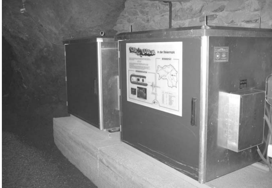
Abb. 3: Datenakquisitionseinheit und Stromversorgungsanlage der Station ARSA. Fig. 3: Data acquisition unit and power supply unit at station ARSA.

Besonderes Augenmerk wurde auf die Ausfallssicherheit des Systems gelegt. Um Potentialunterschiede auszugleichen wurden sämtliche Anschlüsse der Anlage an einem Punkt geerdet.